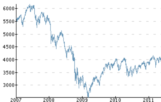
Evolution du CAC 40 depuis le 1 er Janvier 2007