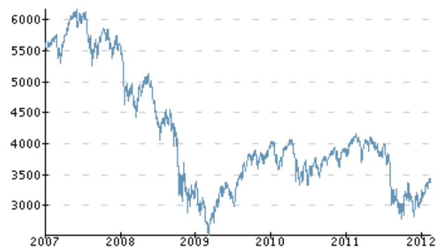
Evolution du CAC 40 depuis le 1 er Janvier 2007